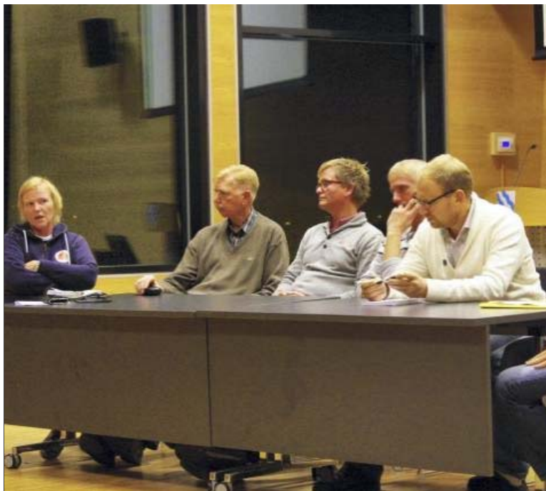
TO SIDER: Panelet består av interessenter fra motorsportsmiljøet og skyttermiljøet.